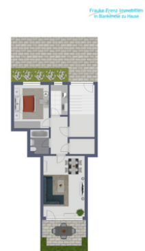
Grundriss Mühlenberger Weg_EG