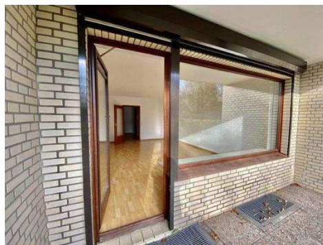
Blick zum WZ