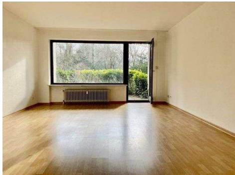
Wohnzimmer mit Süd-West-Terrasse