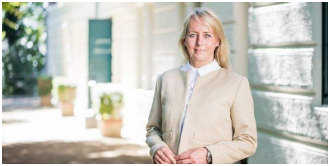
Frauke Frenz Immobilien

Frauke Frenz Immobilien in Blankenese zu Hause