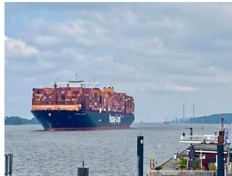
Anleger Op'n Bulln