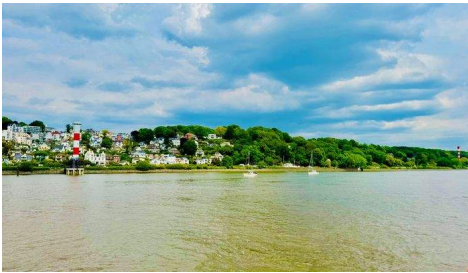
Wohnen im Grünen und Elbnah